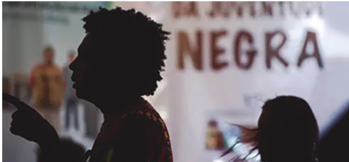
Lei 14.532/2023 equipara crime de injúria racial ao de racismo e, agora, ambos são inafiançáveis e imprescritíveis

“O Anuário traz dados reveladores, que tem sido de grande