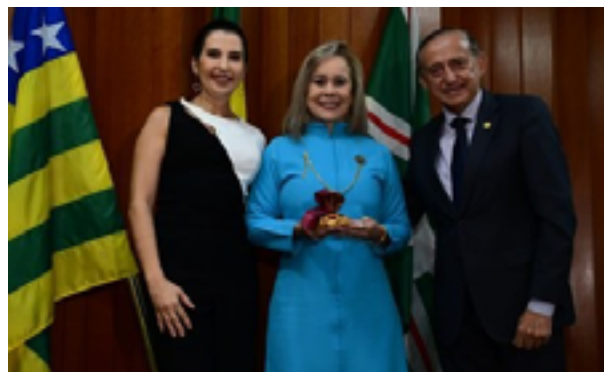
Cerimônia contemplou quem apoia a cultura do Estado