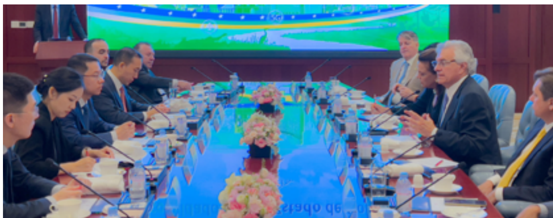
Comitiva goiana participou de várias atividades e reuniões no continente asiático: Goiás terá investimento chinês

abastecer a América Latina”, afirmou o governador.