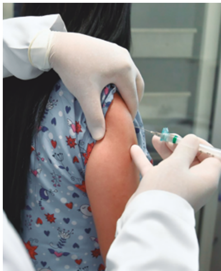
Objetivo de ministrar as doses é garantir a aplicação das vacinas recomendadas pelo Programa Nacional de Imunizações (PNI)

- Fazer refeições leves, pouco condimentadas.