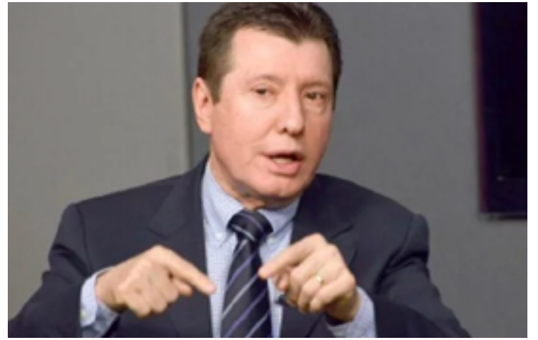
José Nelto: aliado de Lula na Câmara dos Deputados