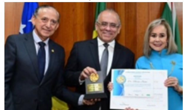
Intelectuais homenageados nos 54 anos da Aflag