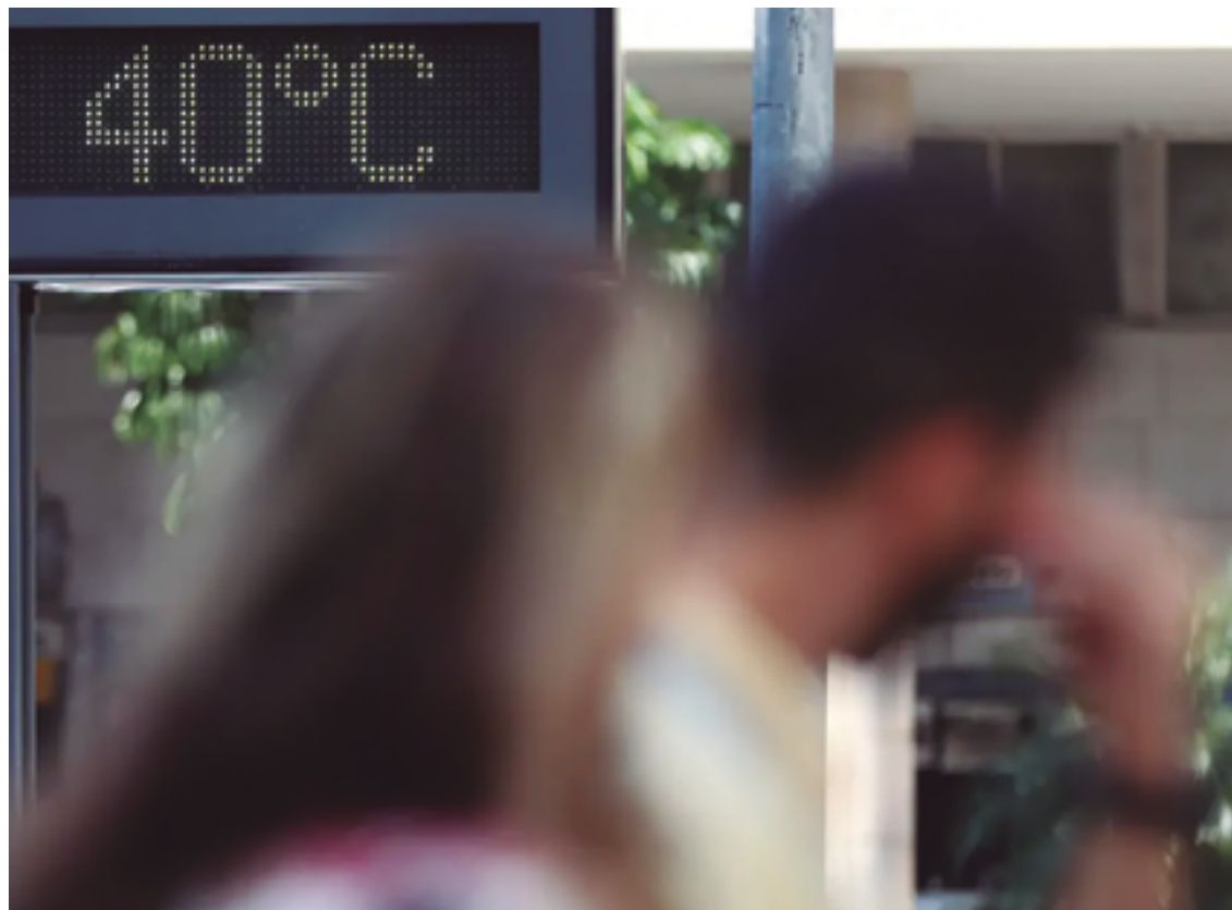
A temperatura nunca esteve tão elevada em no município e região como a registrada nas últimas semanas

acessar o site da Prefeitura de Anápolis pelo Portal da Educação, selecionar a fase em que deseja fazer a inscrição e preencher todos os dados pessoais necessários. Os estudantes que estavam na lista de espera da Educação Infantil (fase creche) devem atualizar o cadastro. O resultado da inscrição estará disponível no Portal da Educação a partir do dia 15 de janeiro de 2024.