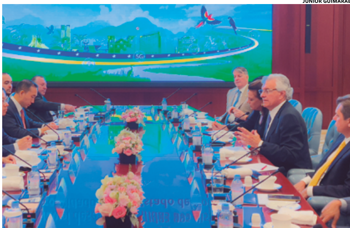
Ronaldo Caiado: “fechamos acordos que vão gerar emprego e renda, e parcerias para pesquisa e inovação”

“Tivemos um avanço histórico. A missão foi extremamente produtiva, pois fechamos acordos que vão gerar emprego e renda e garantimos parcerias que vão promover a pesquisa e a inovação em Goiás”, ressaltou Caiado, horas antes de voltar ao Brasil. Um dos principais destaques foi a assinatura do acordo comercial para a instalação e início das operações da multinacional de energia renovável Chint Power no município de Itumbiara. O plano de investimentos será apresentado pelo grupo nos próximos meses.