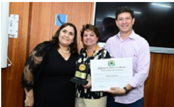
Agraciados na noite que celebra 54 anos da Aflag