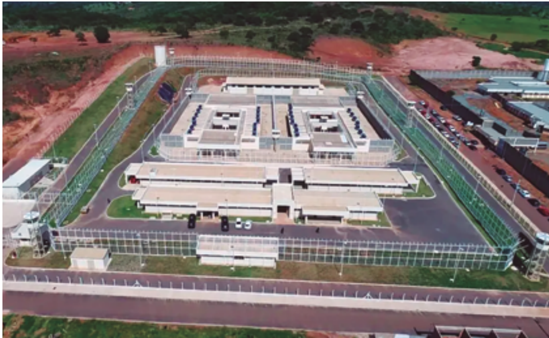
Ministério Público de Goiás instaurou um procedimento administrativo para acompanhar a adoção das medidas

O processo funciona assim: a cada obra lida, o preso tem direito a reduzir quatro dias de pena, após a leitura ser certificada por uma comissão de validação.