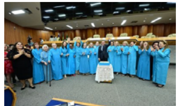
Evento reuniu intelectuais goianos na Câmara Municipal