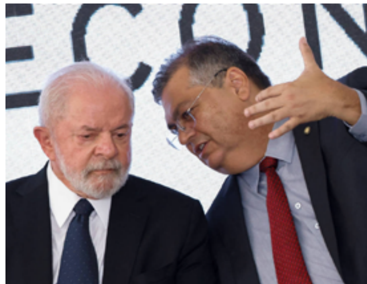
Lula da Silva e Flávio Dino: sem envolvimento com membros do narcotráfico