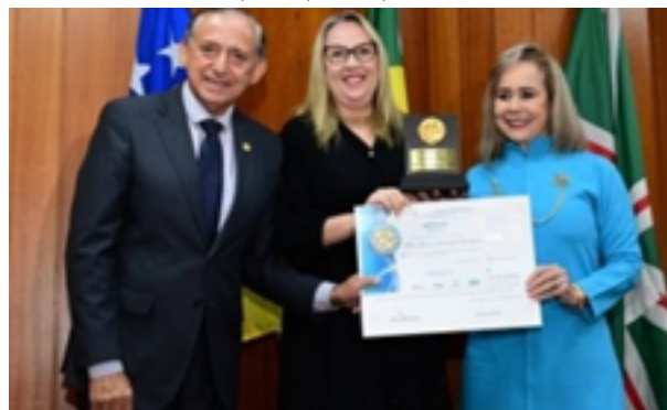
Aflag celebrou quem produz arte e apoia a cultura