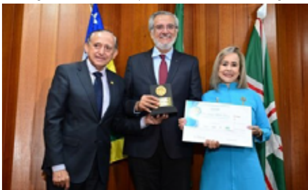
Sessão na Câmara premiou mulheres e personalidades