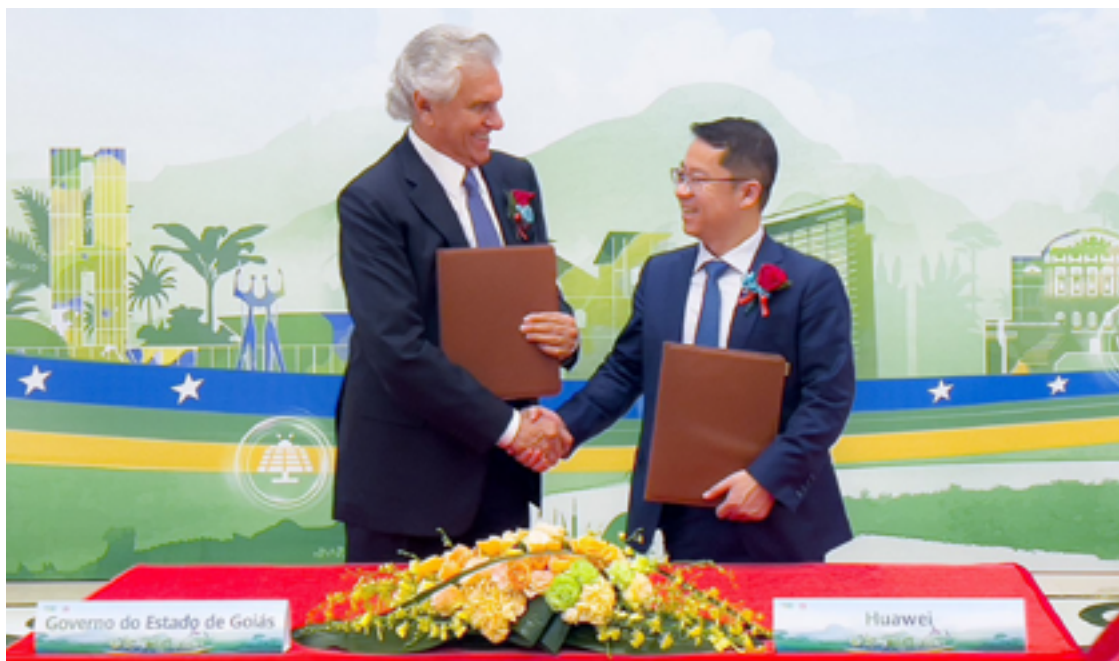
Governador Ronaldo Caiado trouxe acordos de cooperação e expectativa de investimento de seis indústrias

Também avançaram as negociações com os grupos CMOC, indústria de mineração e beneficiamento de nióbio e fosfato, que projeta investir R$ 3 bilhões em Goiás, e com a Weichai Group, topo do ranking em produção de motores elétricos, outra com interesse no município de Itumbiara. “Tivemos a oportunidade de avançar na negociação. Elevaremos o patamar tecnológico de Goiás, que será referência na produção de produtos de ponta em nosso estado, com a possibilidade de